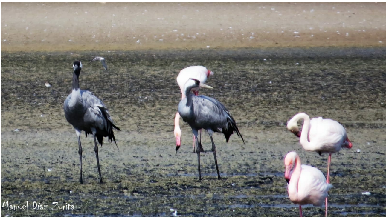
Imagen nº 5: Primeras grullas en Fuente de Piedra (MA).