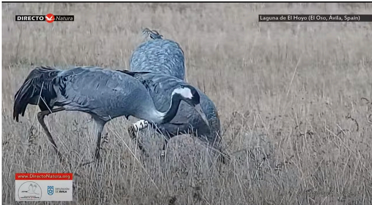
Imagen nº 4: Grulla de origen polaco en la lagª del Oso (AV).