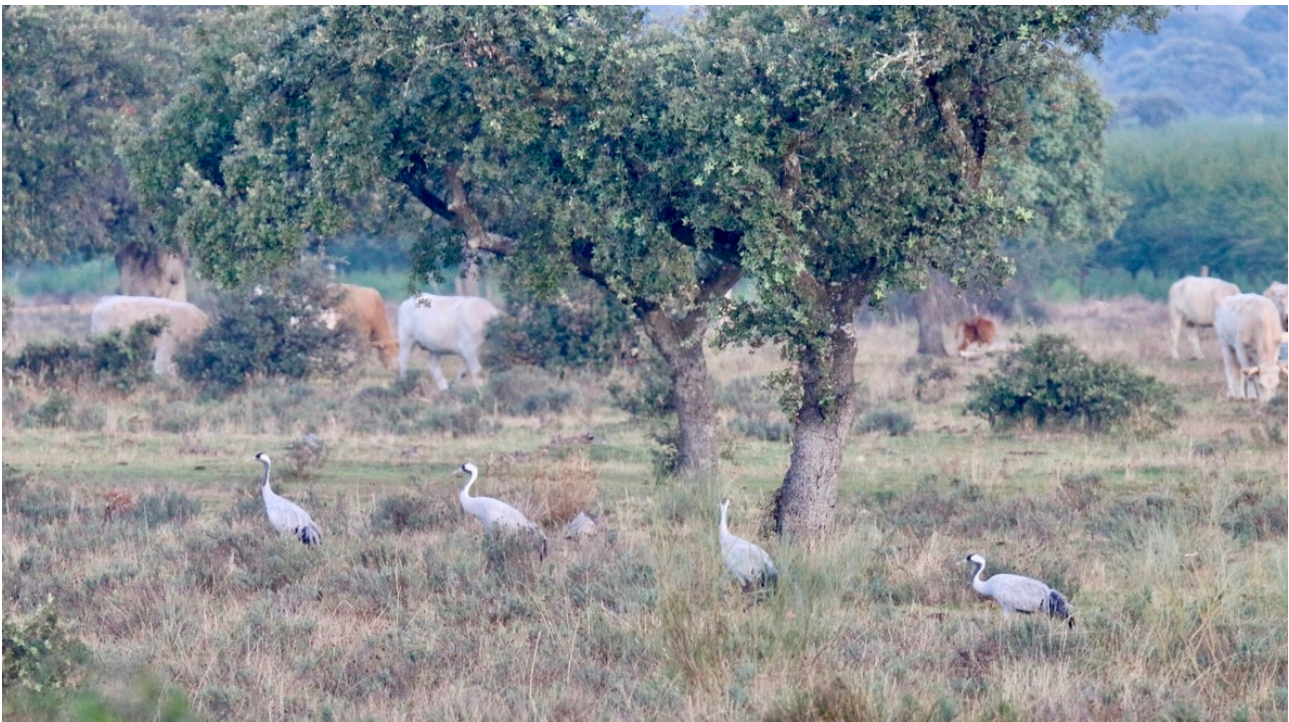
Imagen nº 6: Grullas en dehesa de Valdepalacios (BA).